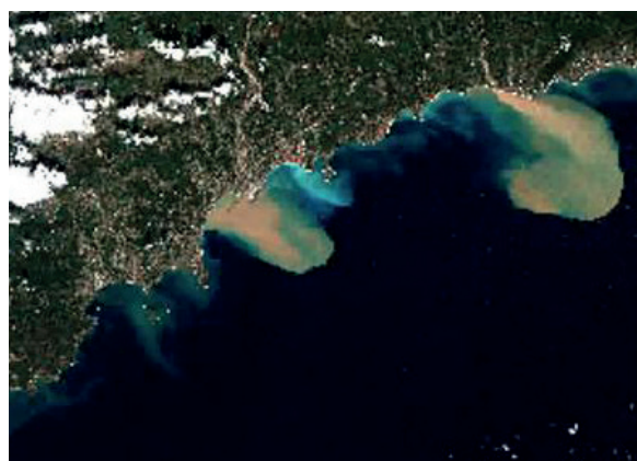
Image Sentinel 2 des crues d'octobre 2020 dans les Alpes-Maritimes

Des pluies diluviennes occasionnées par la tempête Alex ont provoqué des crues soudaines dans les Alpes-Maritimes le 2 octobre 2020. Ces inondations ont causé d'importants dégâts, tant humains que matériels. Le service Copernicus de gestion des urgences (Copernicus Emergency Service) a été activé pour suivre cette catastrophe avec l'acquisition d'images spatiales haute-résolution et la production de cartes.